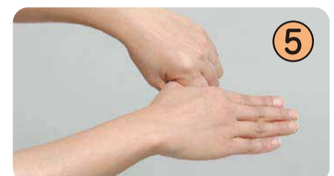
⑤ 握住大拇指和手心，反复拧搓清洗。