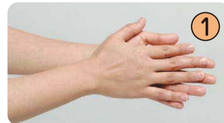
① 用流水淋湿双手后，擦肥皂，反复揉搓手心。