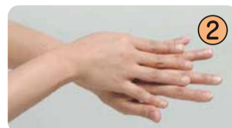
② 伸展手掌，搓洗手背。