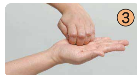
③ 注重指尖和指甲缝隙，仔细揉搓清洗。